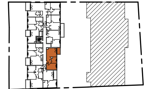
TABLEAU DES SURFACES (compris placards)