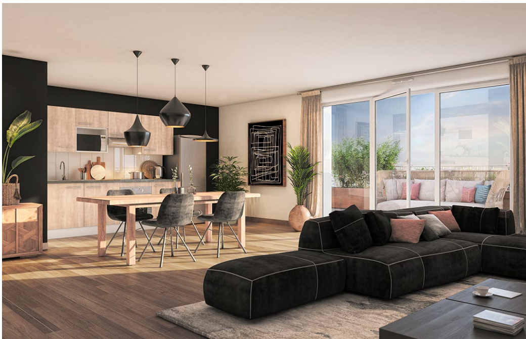
Illustration à caractère d'ambiance - Visuels non contractuels - *Voir plans et notice sommaire